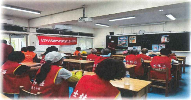
戲水安全守則宣導