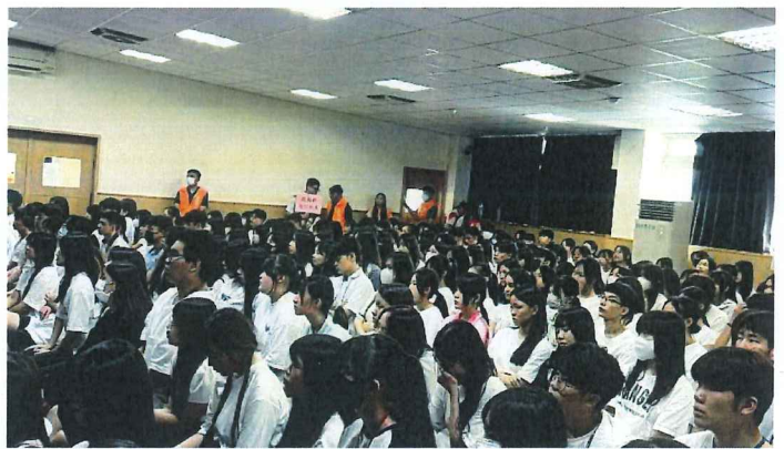
高一新生及導師們聽講