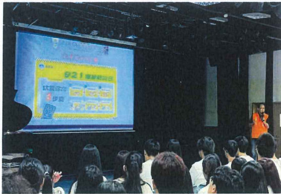
抗震保命3步驟宣講